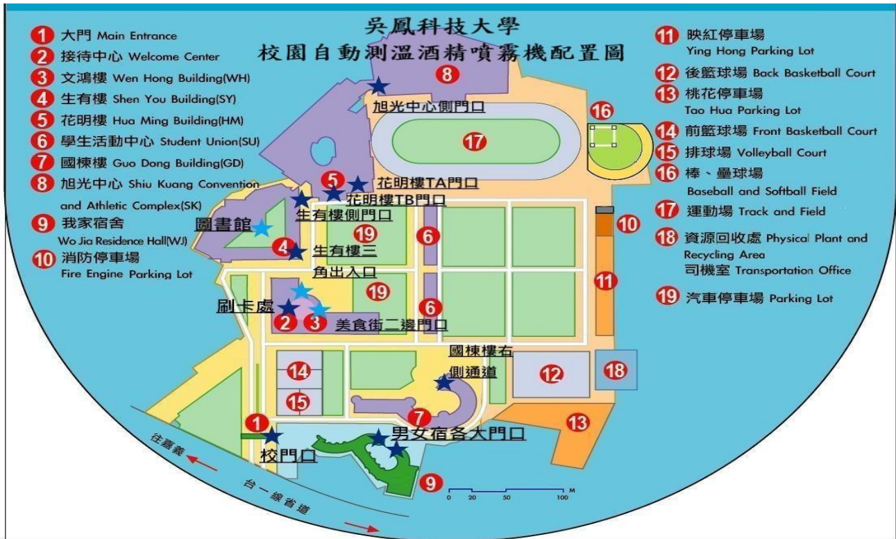
吳鳳科技大學校園自動測溫酒精噴霧機配置圖